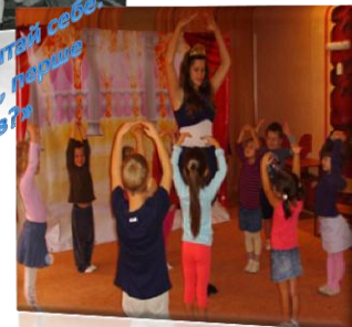
Уранці, коли пробуджуєшся, спитай себе: «Що я маю зробити?» Увечері, перше ніж заснути: «Що я зробив?» Піфагор