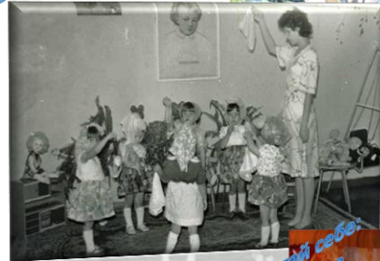
Ми навчаємося не для школи, а для життя. Сенека Молодший