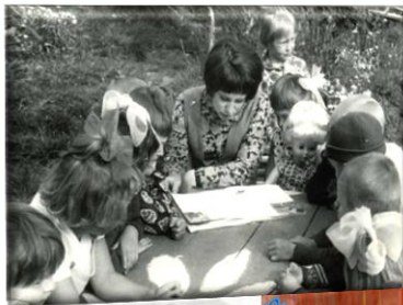
Серце віддаю дітям. В. Сухомлинський