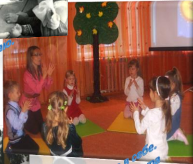
Ваша сила - віра в себе. Ваші здібності - культура самостворення. А. Смоловик